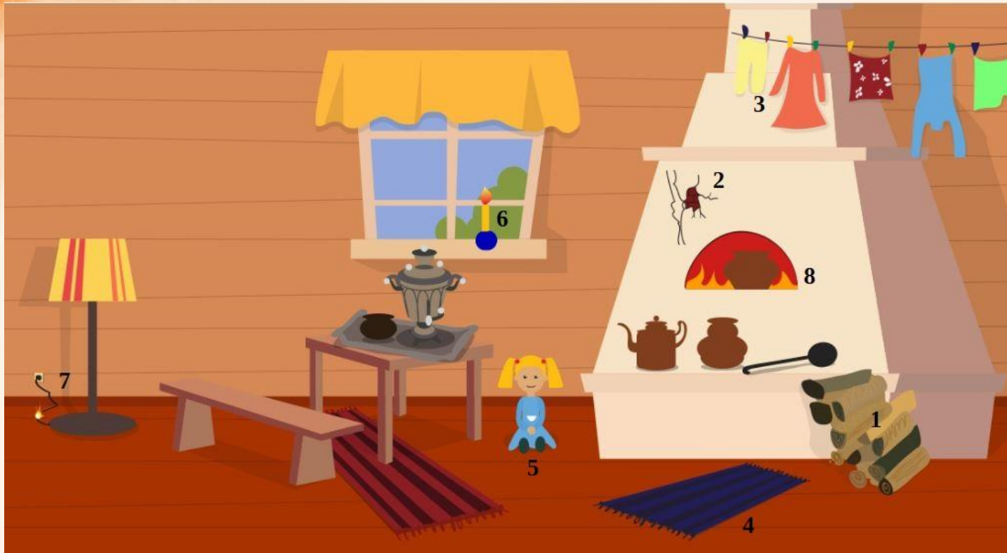
Рис. 1 Проверь найденные нарушения пожарной безопасности в доме