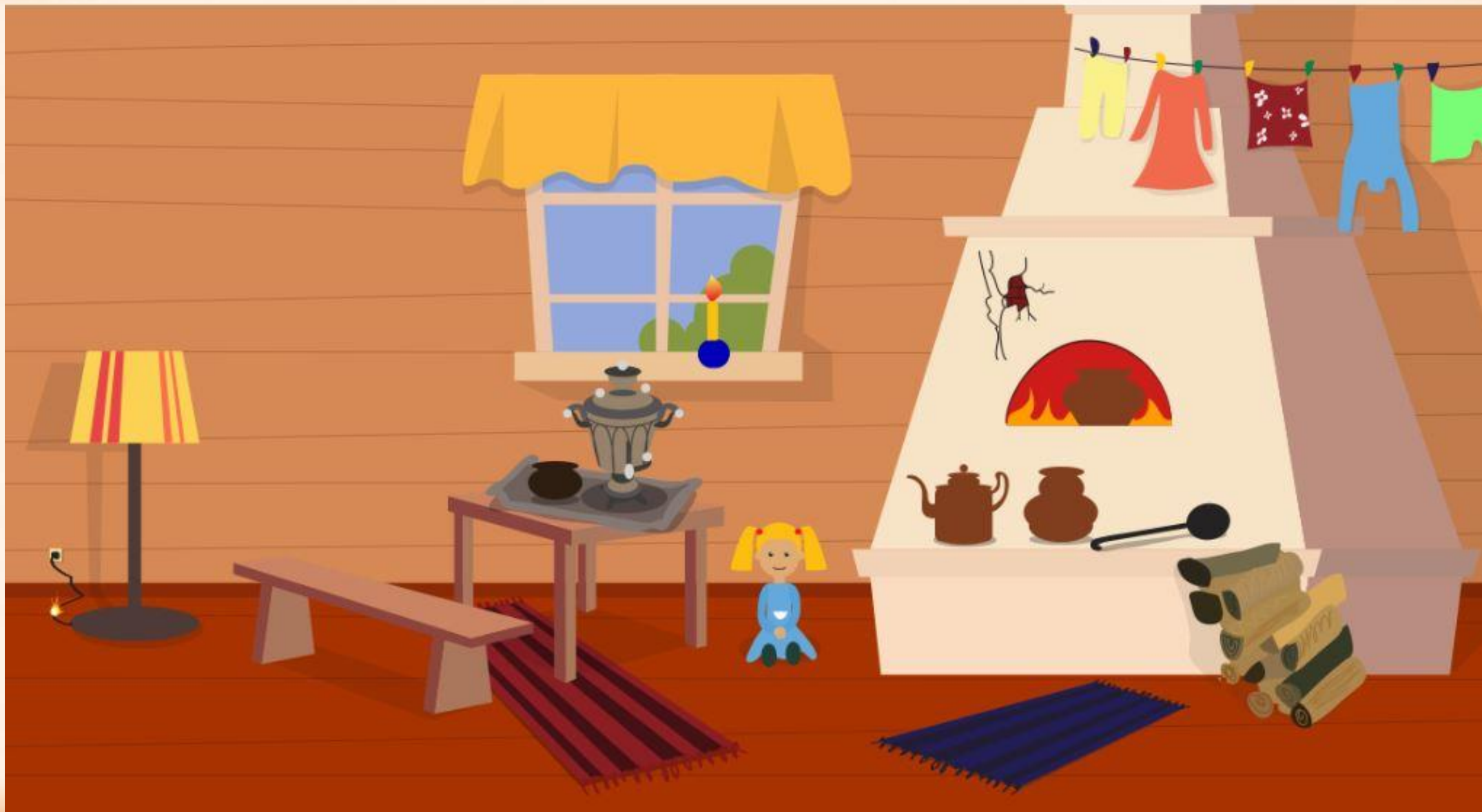
Рис. 1 Найди нарушения пожарной безопасности в доме (8 нарушений)