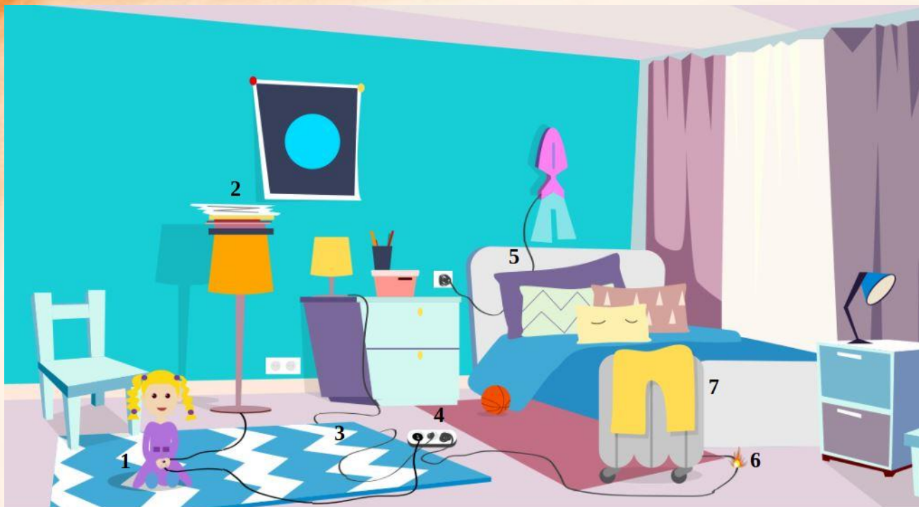
Рис. 5 Проверь найденные нарушения пожарной безопасности в детской