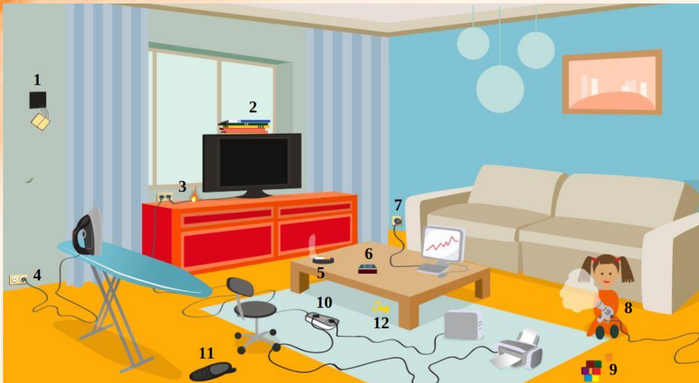
Рис. 3 Проверь найденные нарушения пожарной безопасности в гостиной