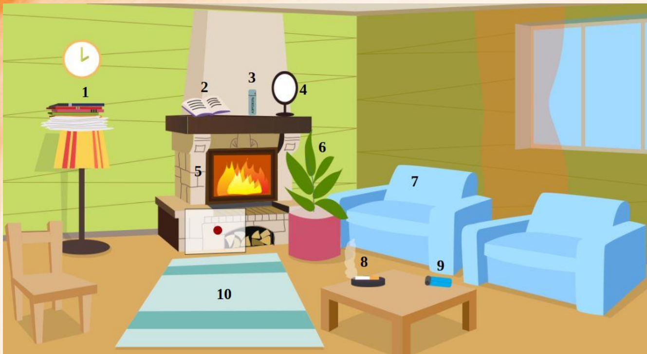
Рис. 4 Проверь найденные нарушения пожарной безопасности в гостиной